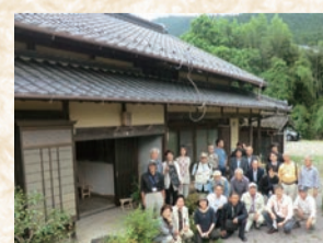
東栄町で開催した総会後の古民家活用プロジェクト見学の様子

三遠南信地域の文化芸術情報の発信と会員団体主催のさまざまな公演の開催協力を行うとともに、公演会場で三遠南信地域のPRにも参加協力しています。