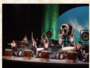
三遠南信プロジェクトの一環として開催された「蒼の大地」公演