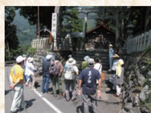
遠山郷で行った地域資源の活用方法研修会の様子