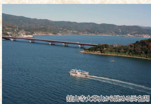
龍山寺大草山が映れる浜名湖