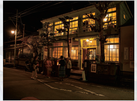
蒲原宿 旧五十嵐邸